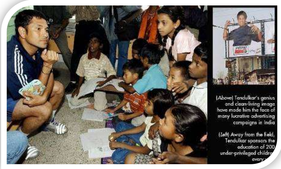
(Above) Tendulkar's genius and clean-living image have made him the face of many lucrative advertising campaigns in India